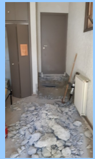
Création d'un accueil d'urgence pour SDF