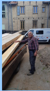
Mise en place de l'escalier