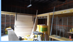
La mezzanine du secrétariat